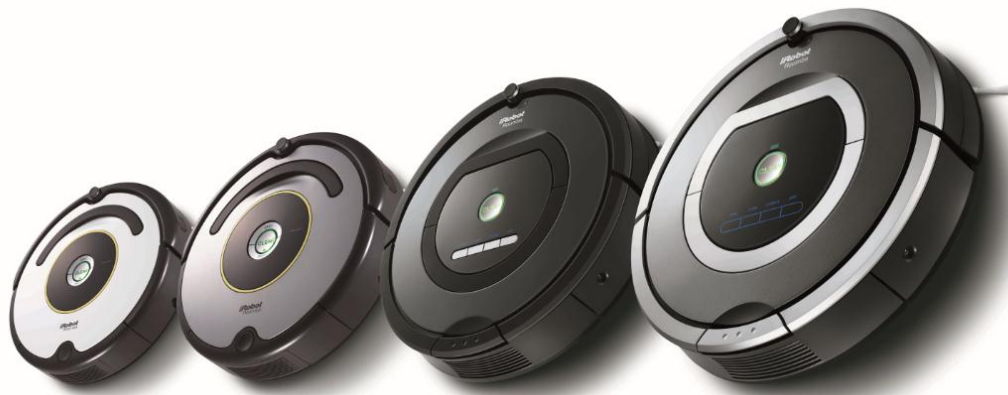
右からルンバ 780・ルンバ 770・ルンバ 630・ルンバ 620

※ iRobot、アイロボット、AWARE、ルンバ、iAdaptは、iRobot社の登録商標です。