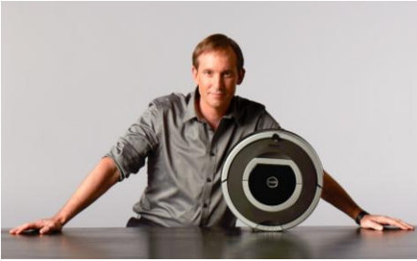
アイロボット社 CEO コリン・アングル

アイロボット社は、米国マサチューセッツ工科大学(MIT)で最先端の人工知能研究を進めていた科学者3人によって1990年に創立されたロボット産業のリーディングカンパニーです。以来、20年以上にわたり、世界のロボット業界を牽引しています。