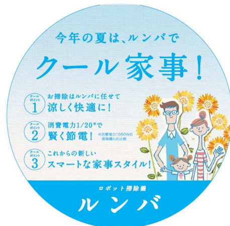
「クール家事」告知イメージ

また、「クール家事」を新概念に、掃除はルンバに任せて、空いた時間で他の家事や自分の時間を楽しみ、賢く節電しながらも涼しくカッコよく家事をする、新しい家事スタイルを提案します。（「クール家事」については次ページ参照）