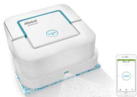
床拭きロボット ブラーバ ジェット 240 http://www.irobot-jp.com/braava/

床拭きロボット「ブラーバ ジェット 240」およびロボット掃除機「ルンバ 960」はともに、昨年発売したフラッグシップモデル「ルンバ 980」につづき、iRobot HOME アプリ*2を通じてスマートフォンから操作ができる、コネクテッドホーム製品のラインナップです。