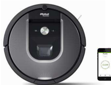
ロボット掃除機 ルンバ 960 http://www.irobot-jp.com/roomba/

アイロボット社 CEO 兼共同創設者のコリン・アングルは次のように述べています。「本年、アイロボット社の家庭用ロボット販売数は、世界で 1,500 万台を突破しました。コネクテッドホーム分野を追求するなかで、日本市場において、複数の製品を同分野に投入すること、マッピング機能やネットワーク機能を持つルンバをよりお求めやすい価格で販売することはアイロボット社にとって大きな契機です。今後もさらにコネクテッドホーム分野での成長に邁進し、さらに多くの方々の暮らしに役立つロボットを開発します。」