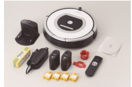
ルンバ 視覚障がい者モデル セット内容 イメージ

通常同梱資材の取扱説明書を音声化(CD2枚組) 本体操作ボタン上に2箇所、ホームベースに1箇所、凸点シールを貼付