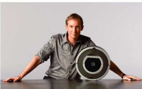
アイロボット社 CEO コリン・アングル

アイロボット社は、米国マサチューセッツ工科大学(MIT)で最先端の人工知能研究を進めていた科学者3人によって1990年に創立されたロボット産業のリーディングカンパニーです。以来、20年以上にわたり、世界のロボット業界を牽引しています。研究者やエンジニアなど、ロボット工学におけるスペシャリストたちが所属する世界規模の企業として認められています。