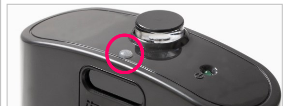
ホームベース(充電器) 凸点シールを貼付