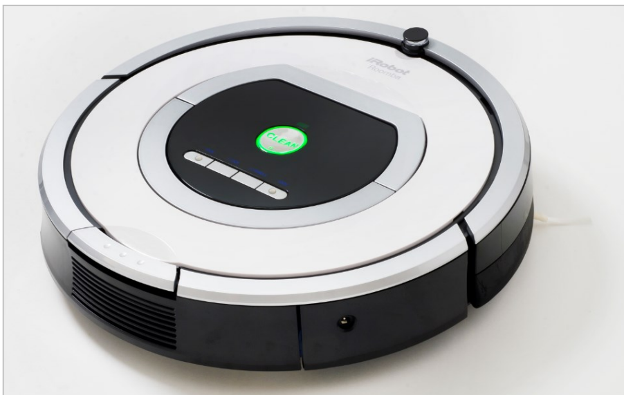
ルンバ 視覚障がい者モデル イメージ

ルンバを開発したアイロボット社は「Dull, Dirty, Dangerous(退屈、不衛生、危険)な仕事から人々を解放する」という理念のもとに、これまで数多くのロボットを開発してきました。ルンバにおきましても、より多くの人々の生活を豊かにするべく、一層の努力を重ねて参ります。